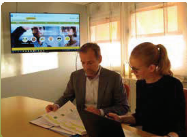
Fotograf Susanne Jorén